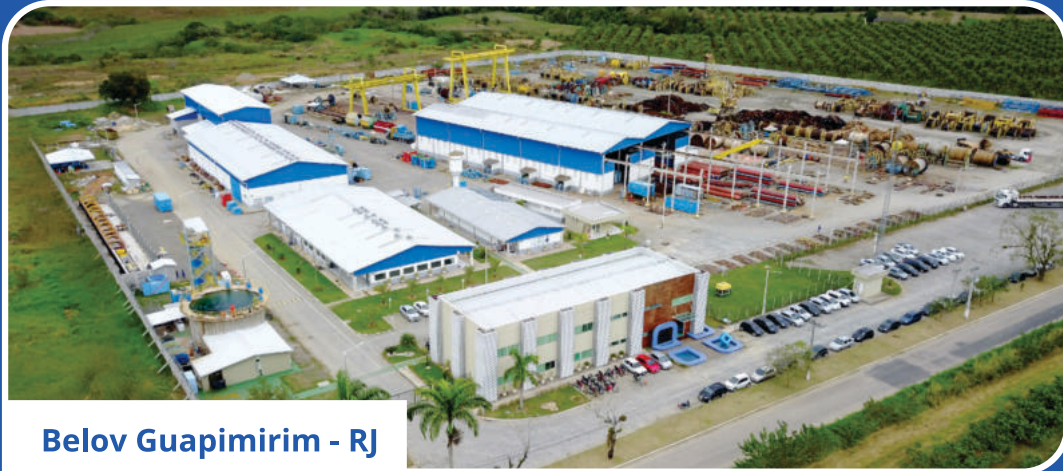
Belov Guapimirim - RJ