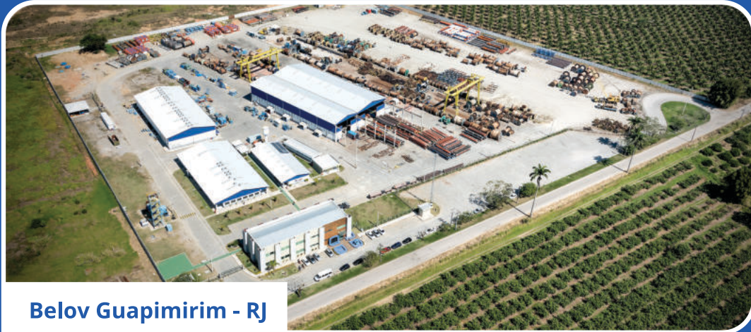
Belov Guapimirim - RJ