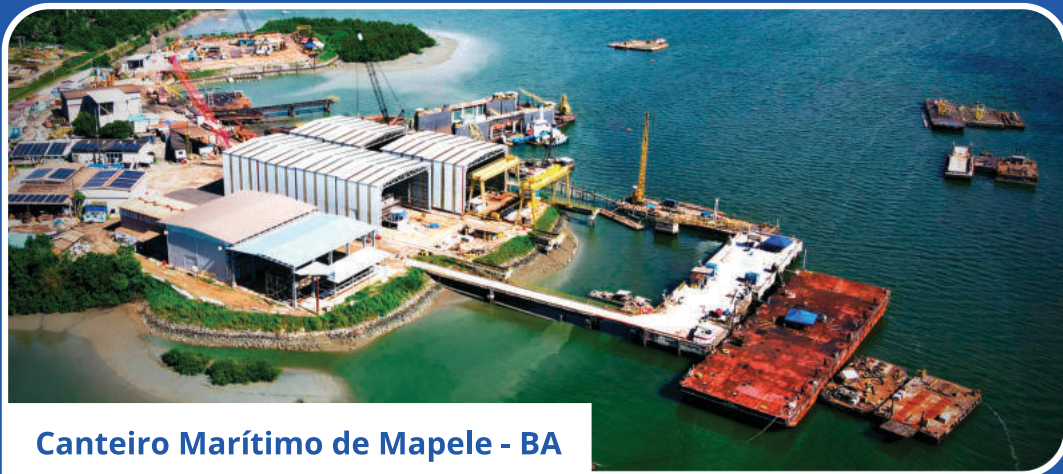
Canteiro Marítimo de Mapele - BA